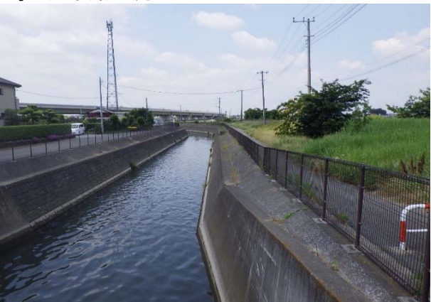
葛西用水路上流から望む