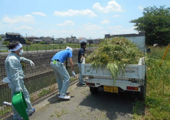
ひと通り積み込みました