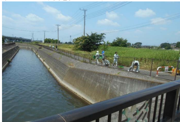
私たちは右岸側を担当します