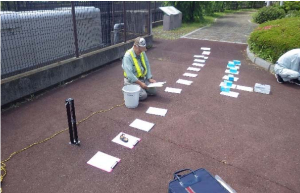
水質検査(上流部にて)