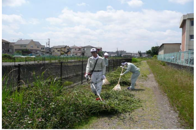
草刈り状況(中流部)