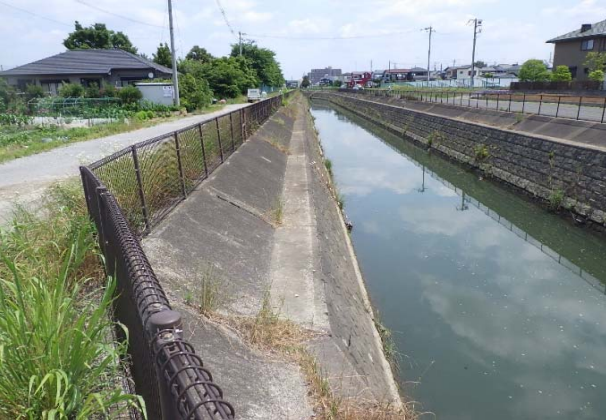
葛西用水路下流から望む