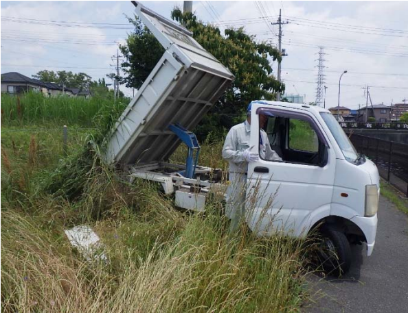
集めた草を仮置きします