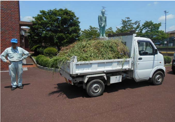
全部でトラック7台分集まりました