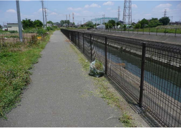
袋いっぱいになりました