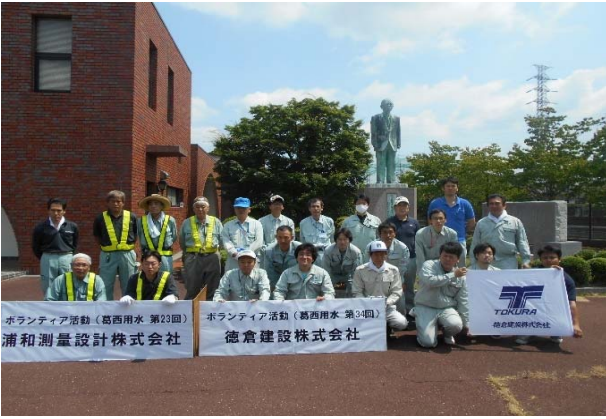
作業前 全体集合写真