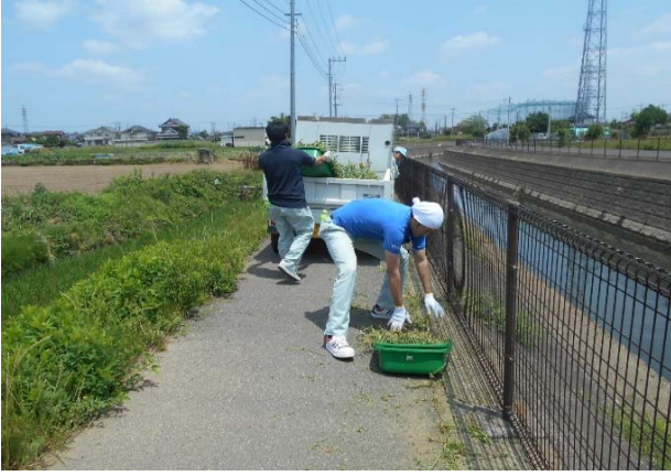
トラックへ積み込み中