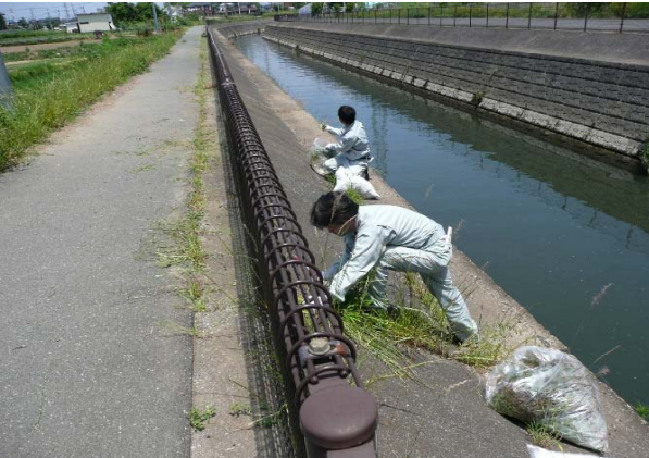
フェンス内草刈り状況