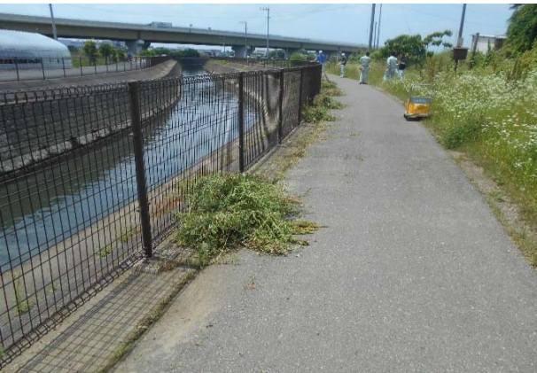
草刈り後はまとめて後で集めます