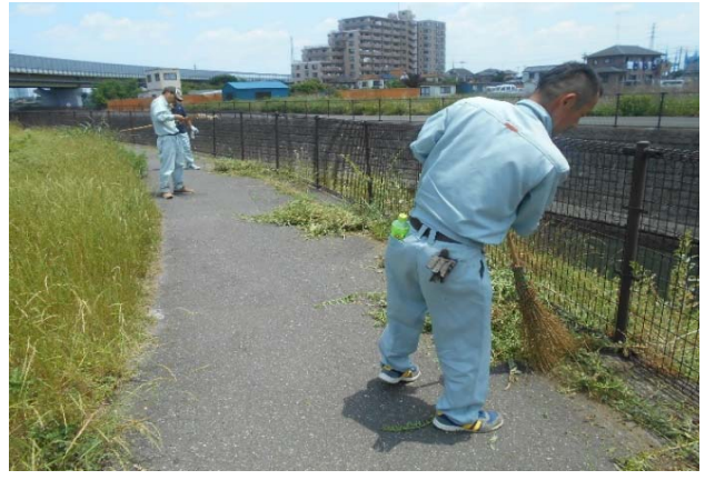
箒で一か所にまとめます