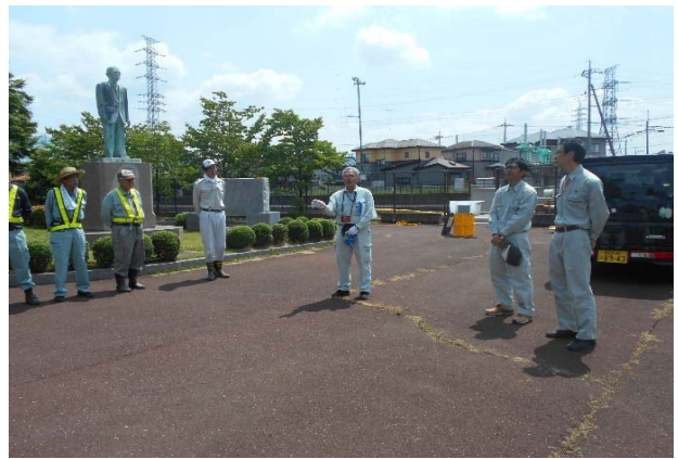
作業前 挨拶・作業内容説明