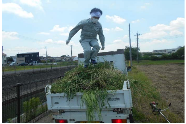
積んだ草を圧縮中