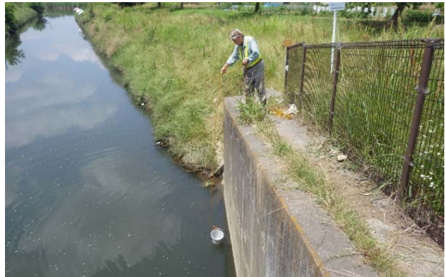
水汲みの様子(下流部にて)