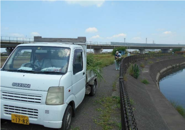
トラックへ積み込み中 その2