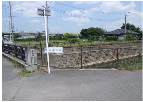
葛西用水路(下流付近)