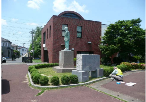
記念館撮影(右側より)