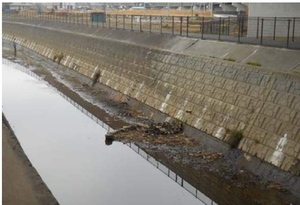
↓ ごみ収集後 キレイになりました！（中流部）