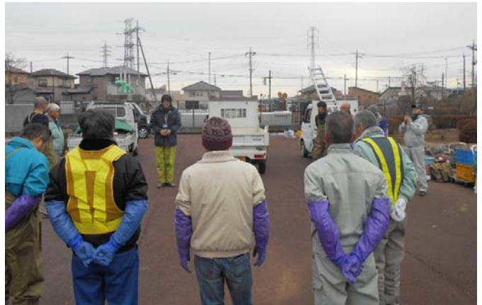
作業前 挨拶・作業内容説明