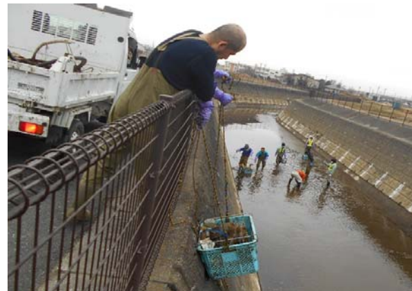
籠でごみを引揚中… 重い…