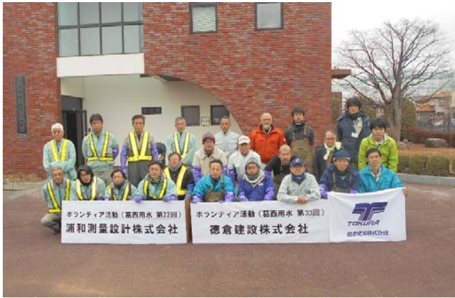
作業前 全体集合写真