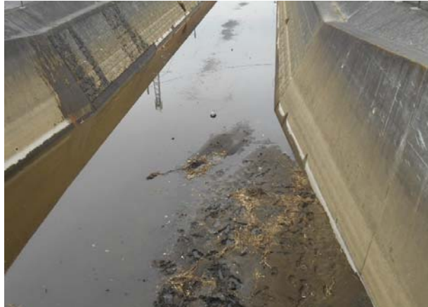
↓ 集積後の様子 キレイになりました！(上流部)