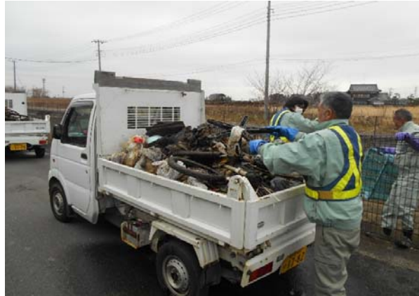
軽トラックで6台分もごみを集積しました！！