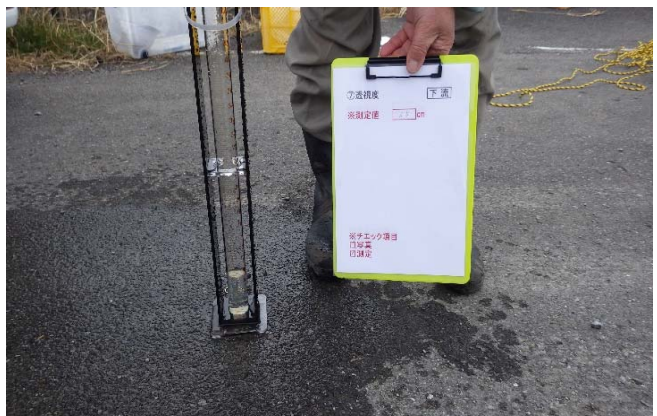
水質検査(上流部・下流部の2か所で行いました)