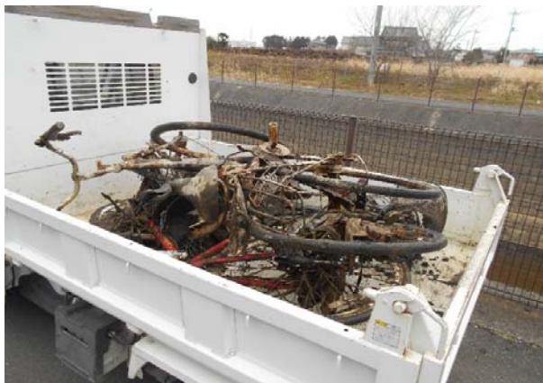
全部で自転車を5台引き上げました！