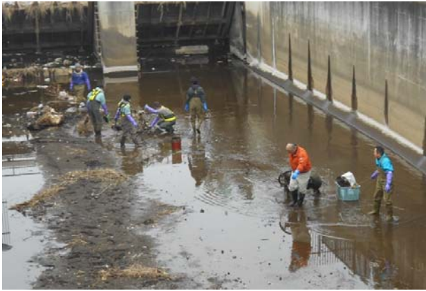
水路内のゴミを集積中(堰堤部)