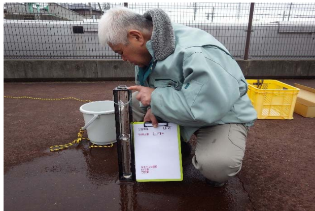
水質検査(上流部にて)