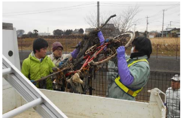
自転車 積み込み中！