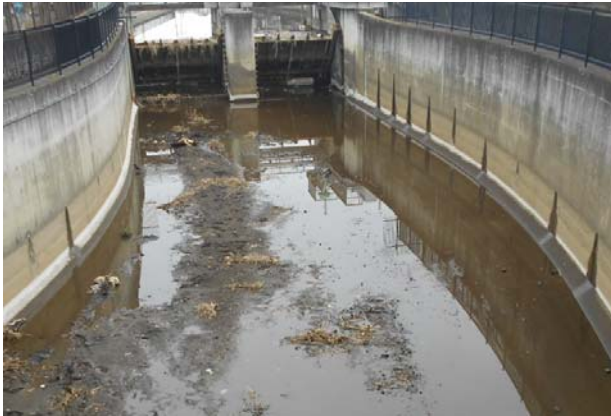
↓ 集積後の様子 キレイになりました！(堰堤部)