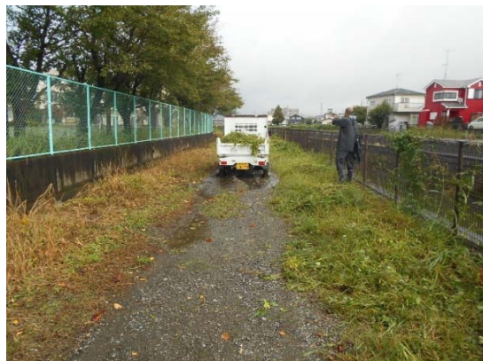
トラック何台分になるでしょう？