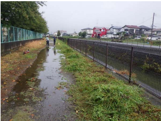
上手に刈れました！