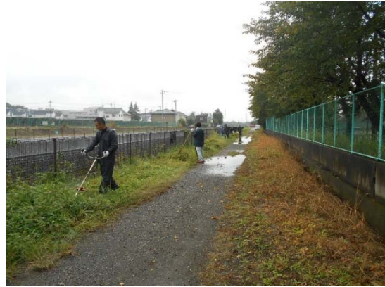
草刈り状況② 雨でも刈ります！