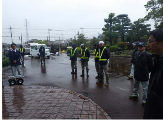
作業前挨拶・作業内容説明②