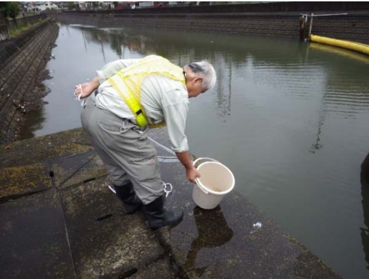
水質検査・上流採取