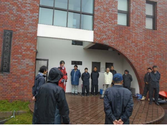
作業前挨拶・作業内容説明①