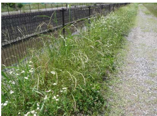
4ヶ月あまりでこれだけ伸びました