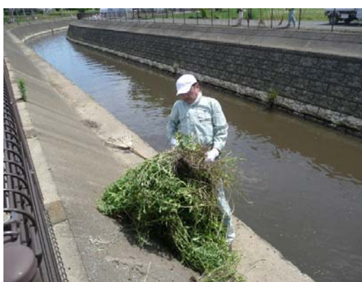
大物も取れました！