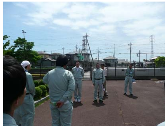
新入社員自己紹介