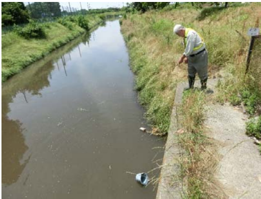
バケツで水を汲みます