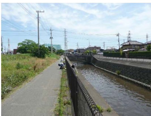
草刈り状況(上流側)