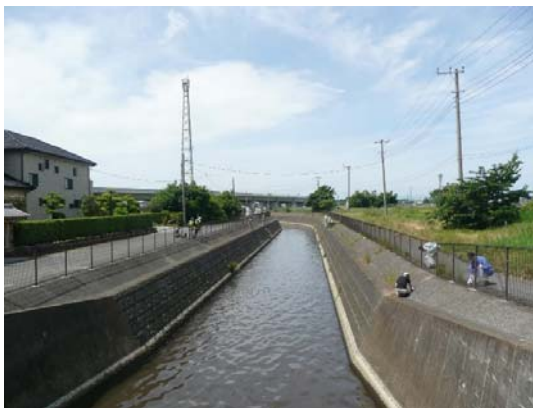
葛西用水路上流側