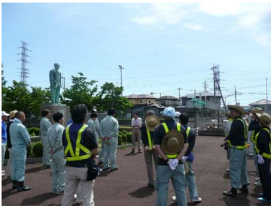
作業前挨拶・作業内容説明