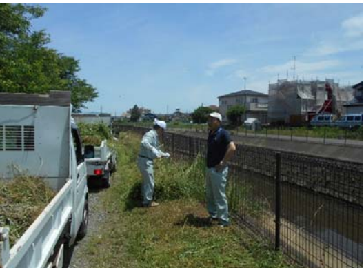
草が多いので軽トラ2台で集荷してます