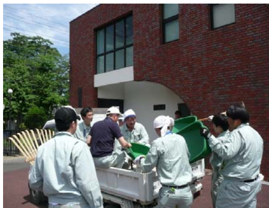
下流チームは軽トラで移動します