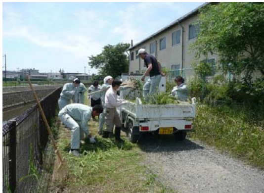
草は踏みつけて積み込みます