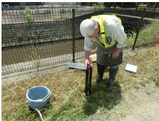
透視度計による透視度試験