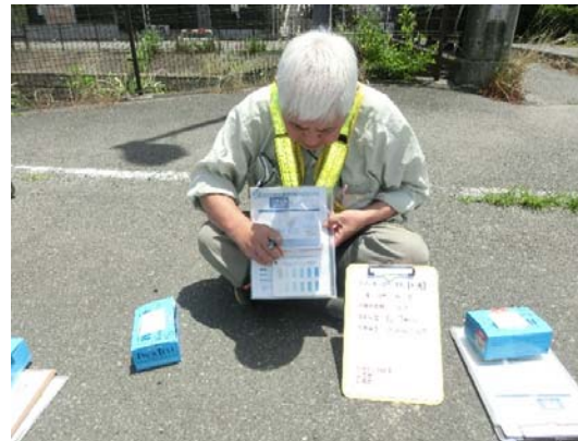
水質調査<アンモニウム態窒素>